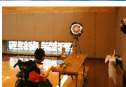
ハンドアーチェリー